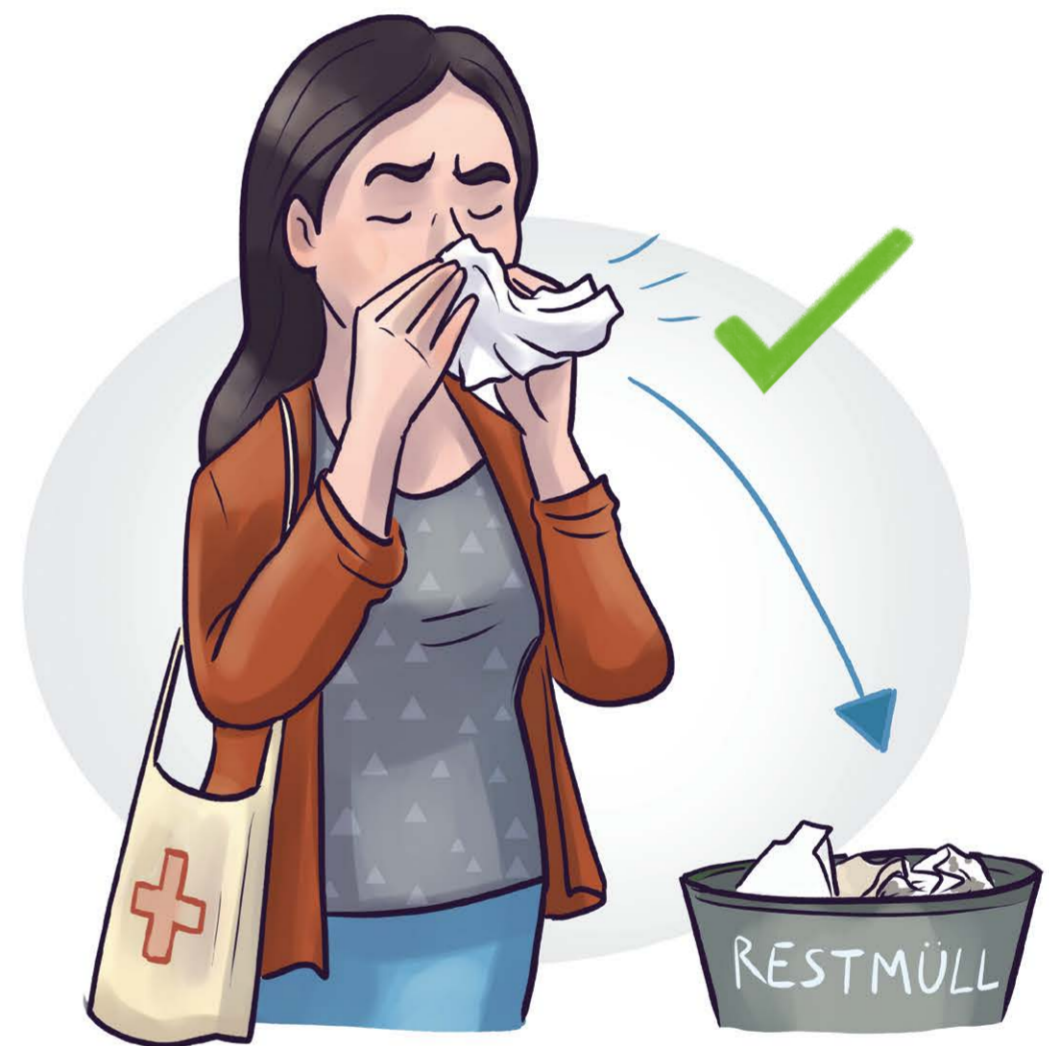
ins Papiertaschentuch schnäuzen und es entsorgen