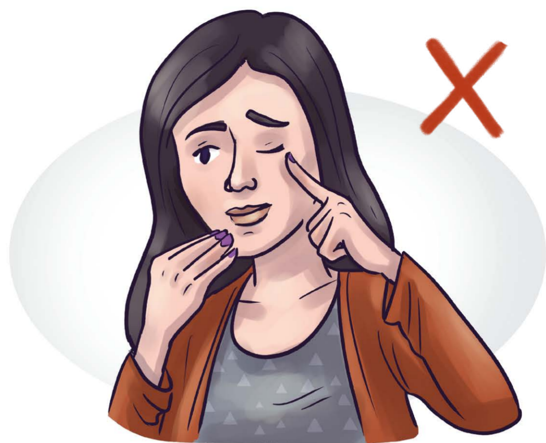
nicht ins Gesicht greifen