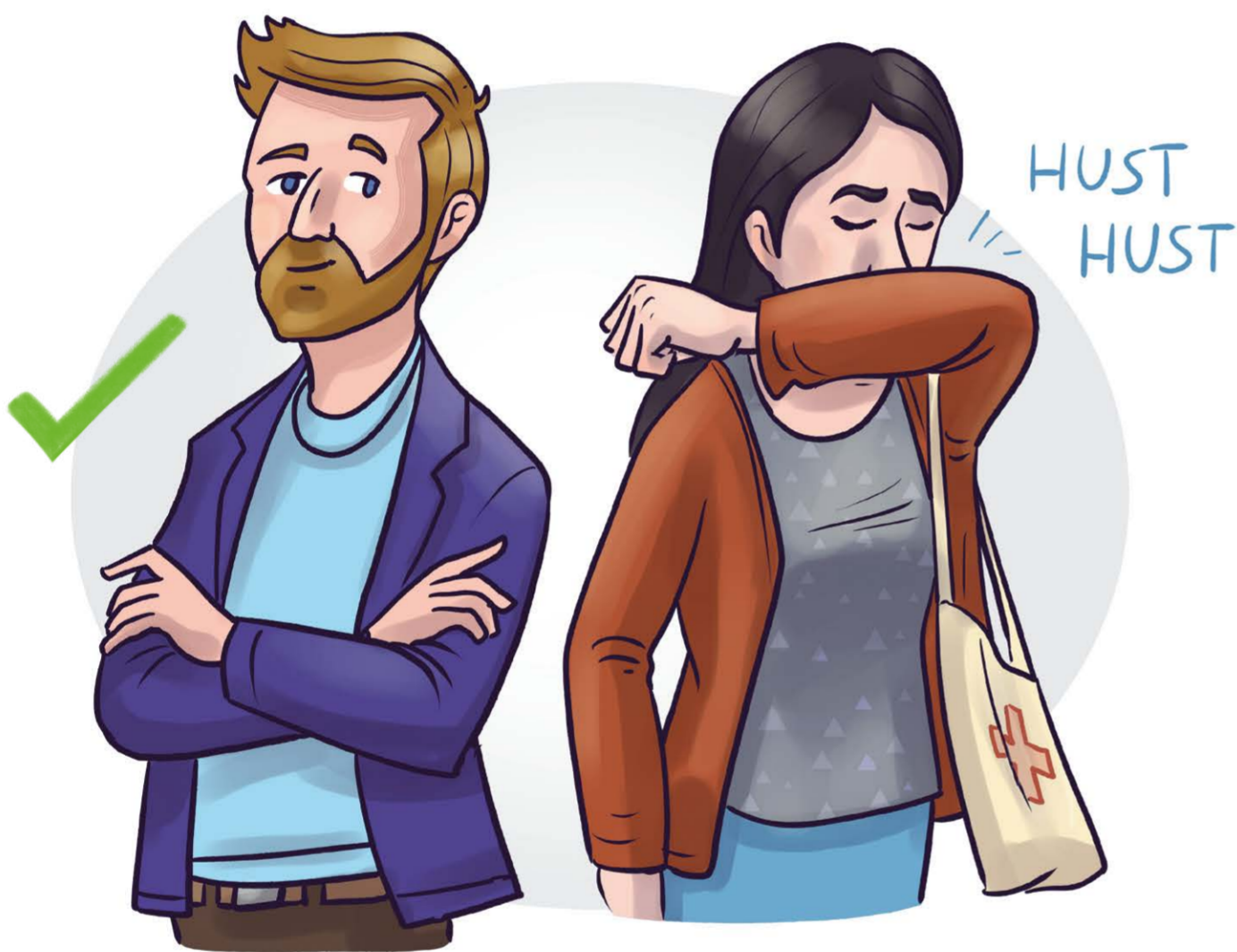
beim Husten/Niesen wegrehen