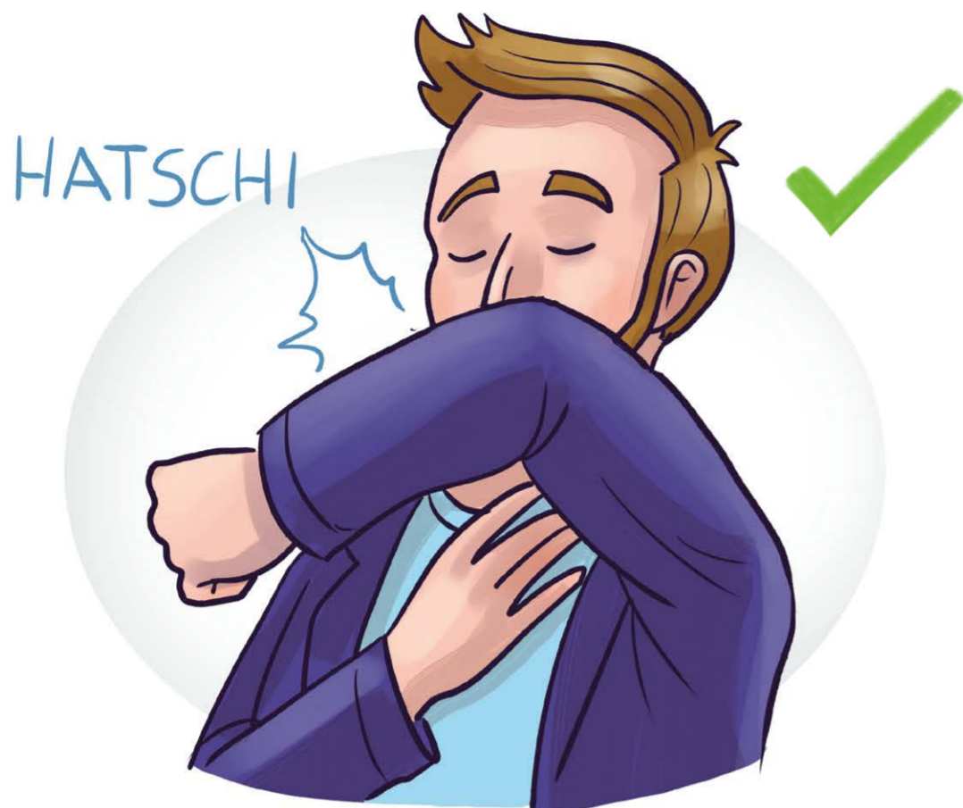
in die Armbeuge husten/niesen